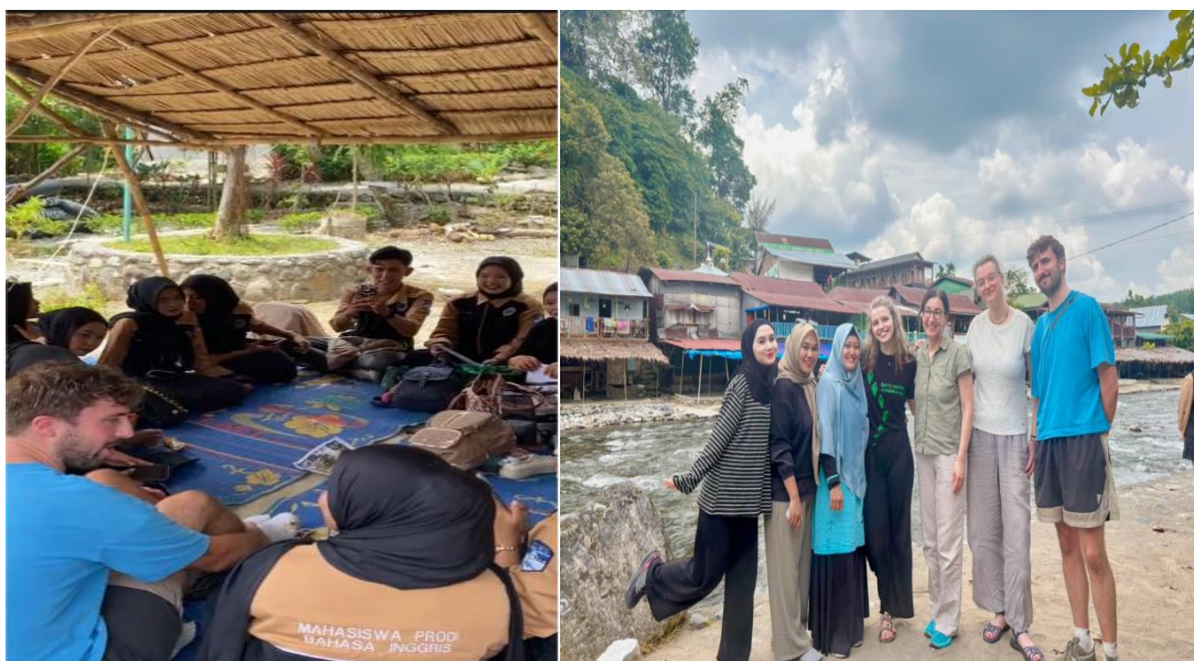
Gambar 2. Praktik Komunikasi Langsung dan Experiential Learning antara Pemuda Setempat dan Turis Asing di Bukit Lawang