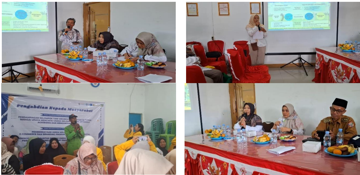
Gambar 2. Diskusi Bersama Kelompok Tani

Langkah selanjutnya adalah sesi diskusi bersama ketua kelompok tani, pengurus dan pendamping kelompok tani untuk mengidentifikasi permasalahan dan kendala yang mereka hadapi dalam mengelola kelompok tani dan menggali potensi usaha apa saja yang dapat dikembangkan oleh kelompok tani dan ditanggapi oleh tim Pengabdian UNSRI.