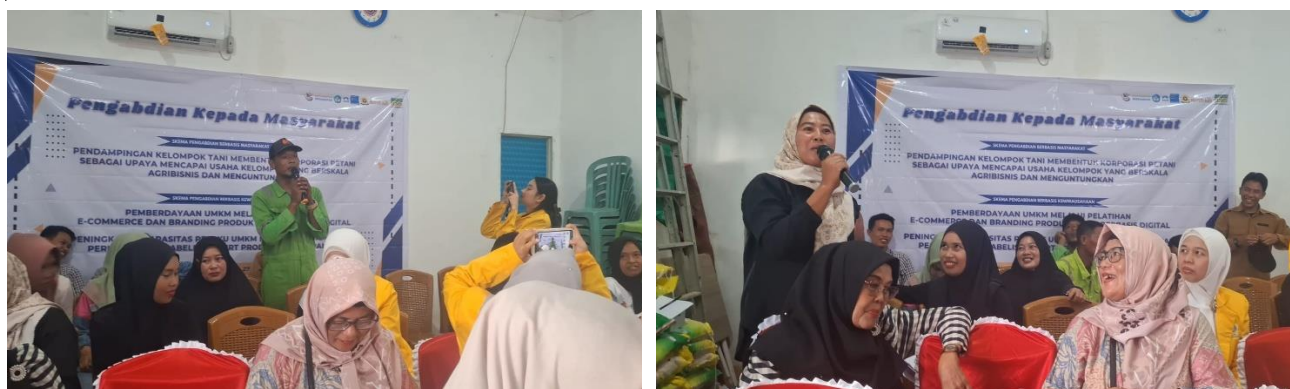
Gambar 3. Diskusi Penyusunan Rencana Bisnis Korporasi

Kegiatan dimulai dengan menyusun visi, misi, dan tujuan dari usaha korporasi petani yang berorientasi pada peningkatan pendapatan dan keberlanjutan usaha. Penyusunan rencana bisnis korporasi mencakup strategi usaha, manajemen aset, proyeksi pengembangan usaha dan potensi kemitraan yang dapat dijalin untuk mendukung rencana bisnis tersebut. Fokus utama dalam penyusunan rencana bisnis adalah pengembangan model usaha kolektif yang dikelola secara profesional melalui korporasi petani.