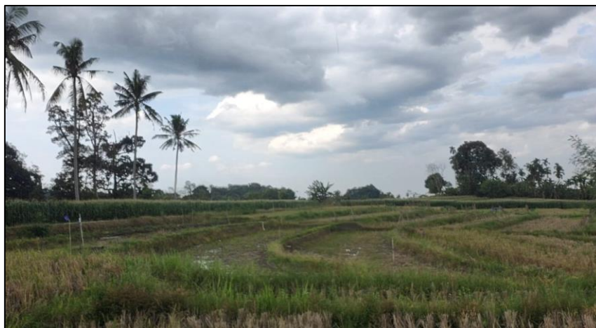
Gambar 1. Lahan Persawahan Mitra

Kelompok Tani “Tani Jaya I” Nagori Sejahtera merupakan kelompok tani aktif yang sebagian besar anggotanya bermata pencaharian sebagai petani padi dengan sistem budidaya sawah irigasi. Kelompok tani ini mengelola lahan persawahan produktif dengan skala kecil hingga menengah dan secara rutin melakukan kegiatan tanam dan panen setiap musim. Dalam praktiknya, petani masih menghadapi permasalahan utama berupa serangan hama tikus dan burung yang cukup tinggi, terutama pada fase pertumbuhan generatif hingga menjelang panen, sehingga berpotensi menurunkan hasil produksi dan pendapatan petani. Metode pengendalian hama yang digunakan selama ini masih bersifat konvensional, seperti pemasangan orang-orangan sawah, jaring, serta penggunaan bahan kimia, yang dinilai kurang efektif dan berisiko terhadap lingkungan. Meskipun demikian, kelompok tani memiliki tingkat kebersamaan dan partisipasi yang baik, serta menunjukkan keterbukaan terhadap penerapan inovasi dan teknologi baru. Kondisi ini menjadi potensi penting dalam mendukung keberhasilan kegiatan pengabdian kepada masyarakat, khususnya dalam penerapan teknologi ramah lingkungan seperti TERAS sebagai solusi alternatif pengendalian hama di lahan persawahan.