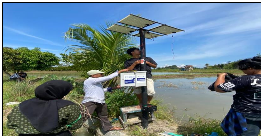
Gambar 2. Pemasangan Teras dilahan Persawahan

lingkungan sekitar. Penggunaan sumber energi tenaga surya menjadikan alat ini dapat beroperasi secara mandiri, berkelanjutan, serta tidak bergantung pada listrik konvensional atau bahan kimia.