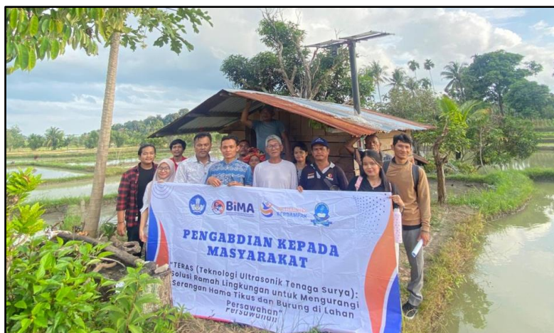
Gambar 6. Pengujian Alat Dan Pendampingan Alat TERAS

Melalui tahapan ini, diharapkan petani mitra mampu mengoperasikan teknologi TERAS secara mandiri dan berkelanjutan sebagai solusi pengendalian hama ramah lingkungan di lahan persawahan.