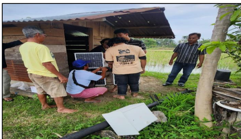
Gambar 5. Pemasangan Tiang dan Alat TERAS

Pada hari ketiga, kegiatan difokuskan pada penentuan titik lokasi pemasangan alat TERAS di lahan persawahan. Penentuan lokasi dilakukan secara partisipatif bersama petani mitra dengan mempertimbangkan luas lahan, jalur pergerakan hama, serta jangkauan efektif alat. Tahap ini bertujuan untuk memastikan alat terpasang pada posisi yang strategis dan optimal. Kegiatan selanjutnya adalah pemasangan tiang penopang sebagai struktur utama alat TERAS. Pemasangan dilakukan secara gotong royong antara tim pengabdian dan petani mitra, sehingga sekaligus menjadi sarana transfer keterampilan teknis. Setelah tiang terpasang dengan baik, kegiatan dilanjutkan dengan pemasangan panel surya dan perangkat ultrasonik pada struktur yang telah disiapkan. Pada tahap ini, petani diberikan penjelasan teknis mengenai arah panel surya, keamanan instalasi, serta perawatan dasar perangkat.