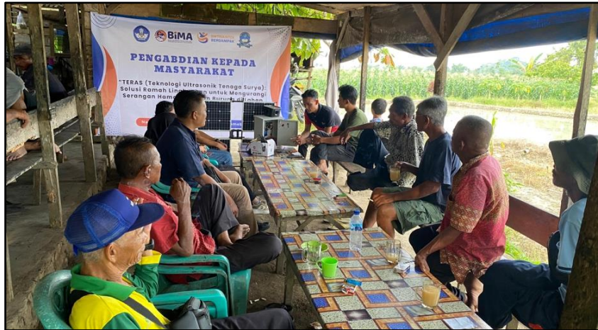
Gambar 4. FGD 2 Demo Alat Teras

Selanjutnya, kegiatan dilanjutkan dengan FGD 2 yang berisi demonstrasi langsung alat TERAS. Pada sesi ini, tim pengabdian mempragakan cara kerja alat, mulai dari komponen utama hingga mekanisme operasionalnya di lapangan. Petani mitra diberikan kesempatan untuk melihat secara langsung proses pengoperasian serta mengajukan pertanyaan terkait penggunaan dan perawatan alat, sehingga meningkatkan pemahaman praktis dan kepercayaan mitra terhadap teknologi yang diterapkan.