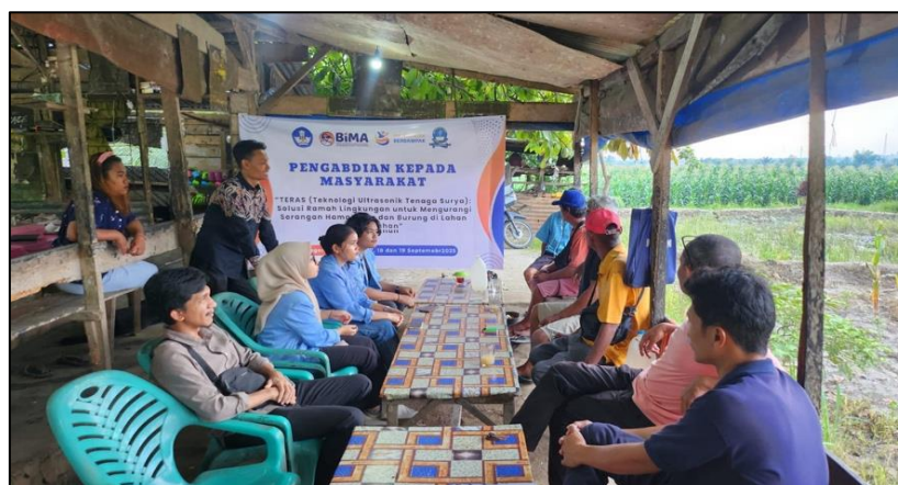
Gambar 3. FGD 1 Sosialisasi PKM dan Tujuan

Kegiatan pelatihan dan implementasi TERAS (Teknologi Ultrasonik Tenaga Surya) diawali dengan pelaksanaan FGD 1 yang berfokus pada pengenalan teknologi TERAS kepada mitra. Pada tahap ini, tim pengabdian menyampaikan latar belakang pengembangan teknologi, prinsip kerja gelombang ultrasonik, serta manfaat penggunaan energi surya sebagai sumber energi alternatif. Diskusi dilakukan secara interaktif untuk menggali pemahaman awal, kebutuhan, serta harapan petani terhadap teknologi yang akan diterapkan.