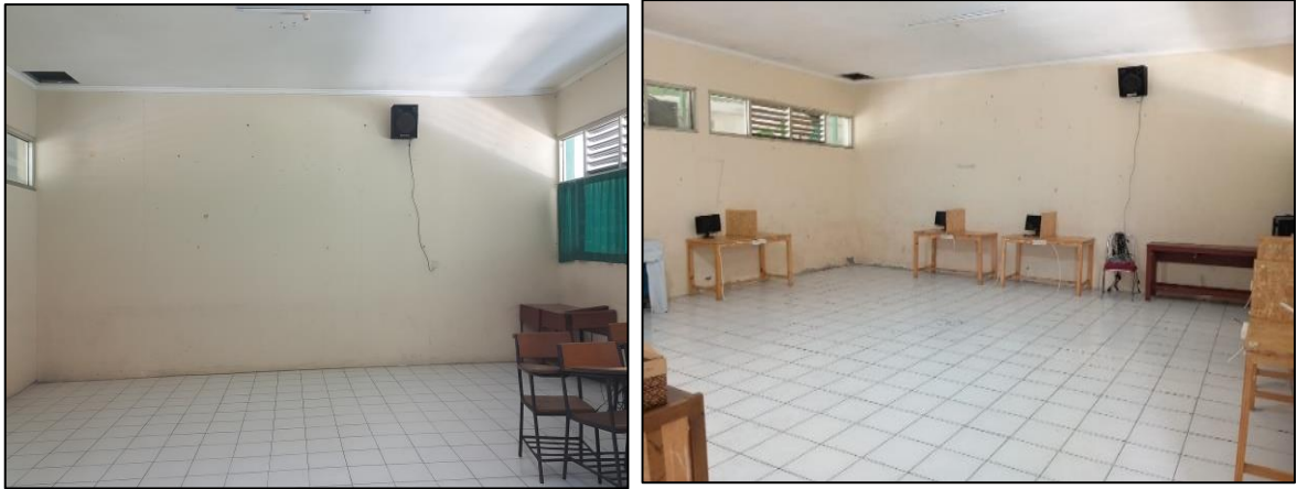
Gambar 1. Kondisi sebelum dan Kondisi Lab yang sudah terinstalasi

Ruang laboratorium IoT yang sebelumnya digunakan sebagai ruang kelas telah dirubah menjadi Laboratorium IoT dengan kelengkapan meja praktik, perangkat jaringan, perangkat komputer, serta peralatan sensor dan modul IoT.