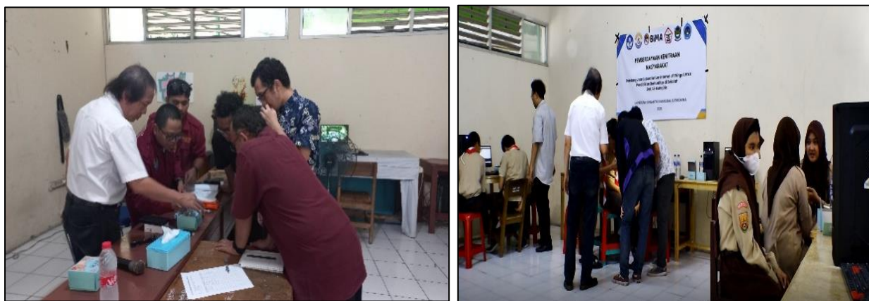
Gambar 3. Pelatihan Guru dan Pelatihan Siswa di Lab IoT