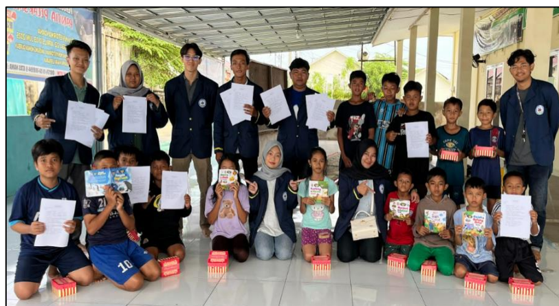
Gambar 2 Pemberian buku dan diskusi isi komik