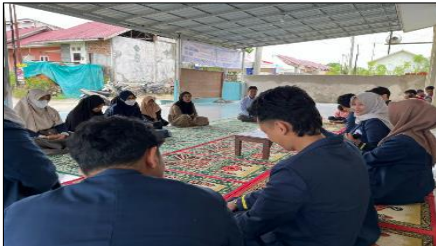
Gambar 1 Tahap observasi awal dengan warga RT 71