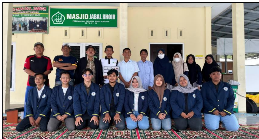
Gambar 5. Dokumentasi dengan mitra

Hasil kegiatan menunjukkan peningkatan minat baca yang signifikan secara kuantitatif. Dari total 30 anak yang berpartisipasi, sebanyak 21 anak (70%) mengalami peningkatan minat baca berdasarkan perbandingan hasil kuesioner sebelum dan sesudah kegiatan. Data ini memperlihatkan bahwa mayoritas peserta merespons positif terhadap intervensi literasi berbasis komik.