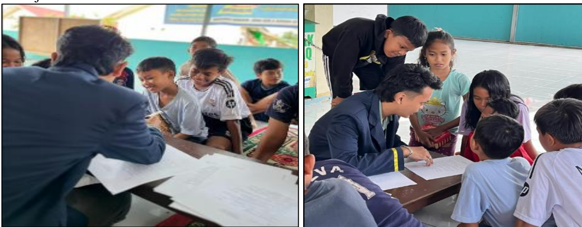
Gambar 3 Pengisian Kuisisioner

Tingkat ketercapaian keberhasilan kegiatan ini dilihat dari tiga aspek: