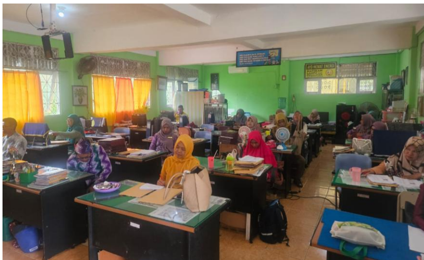
Gambar 2. Peserta Mengikuti Edukasi Pembelajaran Berdiferensiasi

Cara guru dalam menerapkan pembelajaran berdeferensiasi yaitu harus melakukan asesmen terlebih dahulu yang bertujuan untuk mengetahui kebutuhan belajar siswa ketika mau belajar. Penilaian diagnostik merupakan penilaian yang terbagi menjadi dua yaitu penilaian diagnostik kognitif dan nonkognitif. Penilaian kognitif bertujuan untuk mengidentifikasi pencapaian kompetensi siswa, menyesuaikan pembelajaran di kelas dengan rata-rata kompetensi siswa, dan memberikan kelas remedial atau pelajaran tambahan kepada siswa yang kompetensinya masih di bawah rata-rata (Dewi & Prasetyowati, 2023). Adapun tujuan penilaian nonkognitif adalah untuk mengetahui kesejahteraan psikologis dan sosial emosional siswa, mengetahui aktivitas selama belajar di rumah, mengetahui kondisi keluarga siswa, mengetahui latar belakang sosial siswa, dan mengetahui gaya belajar, karakter dan minat siswa (Ardiansyah et al., 2023).