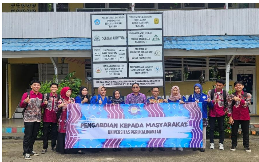
Gambar 2. Tim Bersama dengan Kepala Sekolah dan Guru SDN Telaga Biru 1 Banjarmasin

Pembelajaran yang berbeda diharapkan dapat membantu anak dalam memaksimalkan penyerapan informasi pada pembelajaran. Manfaat menggunakan pengajaran yang berdiferensiasi termasuk membuat setiap siswa, apapun karakteristiknya, merasa dihargai dan dihormati, memungkinkan guru untuk menginstruksikan siswa untuk sukses dan berkembang, memfasilitasi kebutuhan pendidikan siswa, dan membina kolaborasi siswa-guru. Pembelajaran berdiferensiasi dapat mengakomodasi keragaman untuk memenuhi tujuan belajar, berdasarkan kebutuhan kesiapan belajar, minat, dan profil belajar siswa (Elviya & Sukartiningsih, 2023). Dalam proses pengembangan pembelajaran berdiferensiasi, ada beberapa permasalahan yang perlu diatasi, yang paling signifikan adalah keragu-raguan guru dalam menerima pembelajaran berdiferensiasi sebagai bentuk pengajaran dalam kurikulum merdeka. Pembelajaran terdiferensiasi menggunakan beberapa pendekatan pembelajaran dalam satu kelas untuk mengakomodasi keberagaman bakat, kebutuhan dan pengalaman individu siswa dengan pemahaman bahwa siswa merupakan suatu kelompok yang mempunyai kemampuan dan minat yang berbeda-beda. Dengan menerapkan pembelajaran yang berbeda, pendidik harus memenuhi kebutuhan setiap siswa pada tingkat keterampilan yang berbeda di kelas yang sama (Purnawanto, 2023). Karena pembelajaran akan dikembangkan sesuai keinginan siswa, maka pembelajaran yang berdiferensiasi dapat membantu siswa mencapai hasil belajar yang baik.