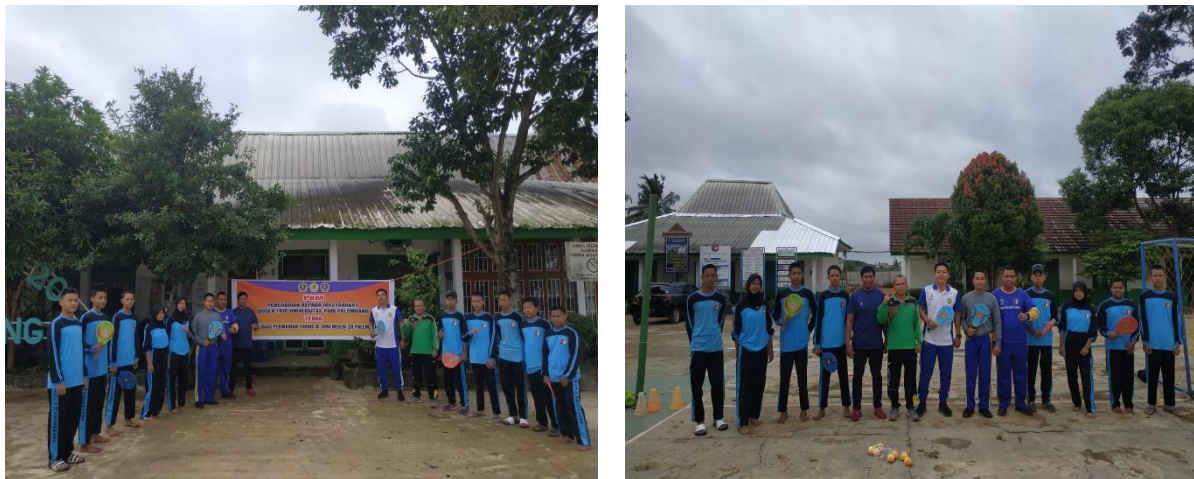
Gambar 1. Tim Melaksanakan PkM

Kegiatan PKM dibuat secara beruntun mulai perencanaan (pengajuan proposal), pelaksanaan PKM ini diadakan pada hari sabtu tanggal 21 Desember 2024 yang berlangsung selama 1 hari dengan kegiatan pukul 08:00 sampai. penyusunan laporan PKM memberikan rincian kegiatan dan jadwal pelaksanaan kegiatan tersebut.