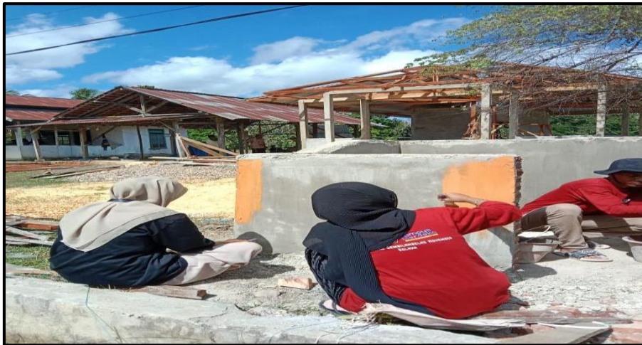
Gambar 10. Pengecatan Tempat pembuangan sampah Permanen.

juga turut berpartisipasi dalam proses pembuatan tempat pembuangan sampah permanen yang telah dikerjakan oleh tim pengabdian masyarakat.