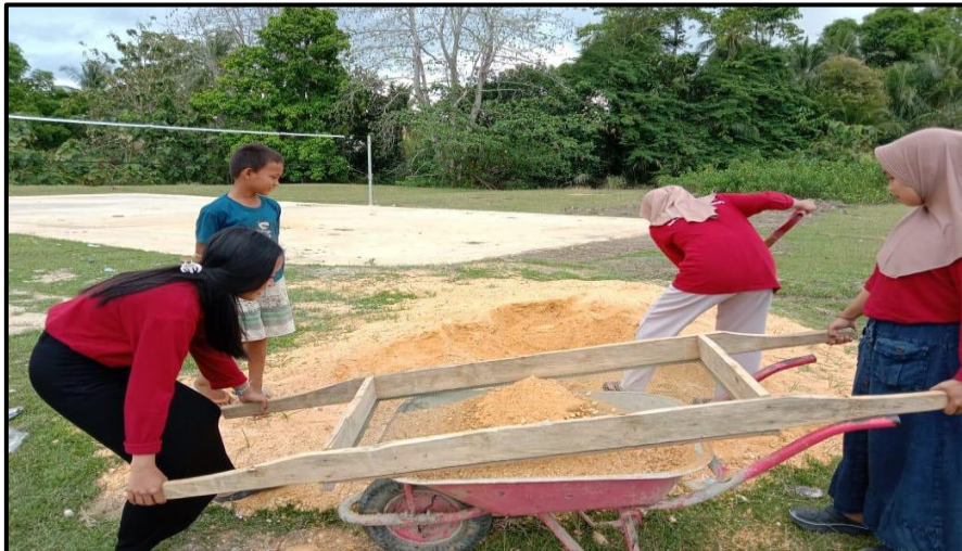
Gambar 5. Proses Penyaringan Tanah Untuk Pembuatan Tempat pembuangan sampah Permanen