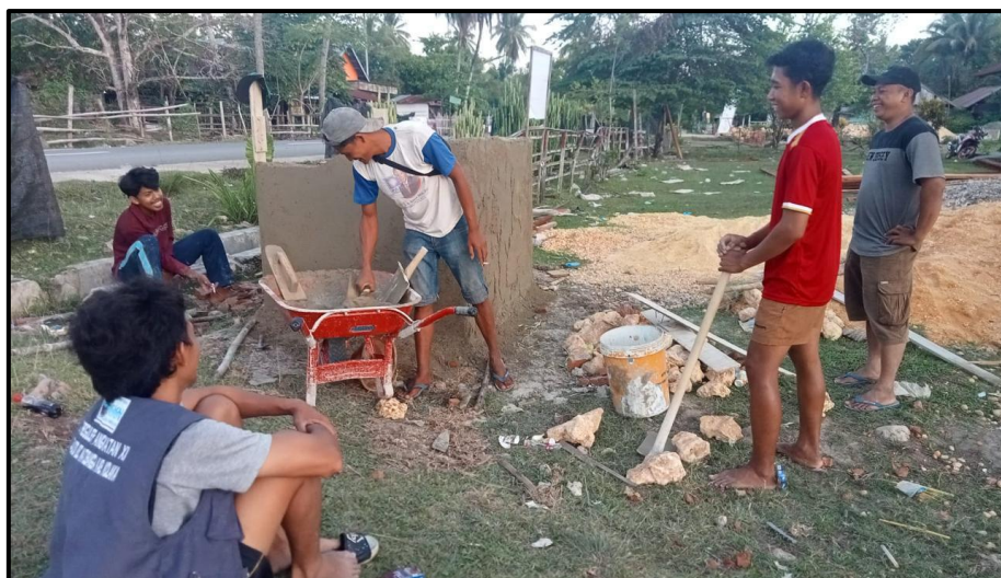
Gambar 7. Proses Pelapisan Semen pada Tempat pembuangan sampah Permanen.

Tahap terakhir adalah penyelesaian tempat pembuangan sampah permanen dengan melakukan pengecatan pada tempat pembuangan sampah yang telah selesai dibangun. Masyarakat