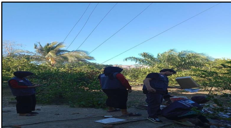
Gambar 4. Pembersihan Lokasi Pengadaan Tempat pembuangan sampah Permanen.

Tahap selanjutnya adalah pelaksanaan pengadaan tempat pembuangan sampah permanen. Tempat pembuangan sampah permanen yang berukuran besar, dengan bahan bangunan yang dipesan dan dibeli dari toko bangunan di Desa Kukutio, mulai dibuat. Tim pengabdian masyarakat bersama dengan masyarakat setempat kemudian bekerja sama untuk membangun tempat pembuangan sampah permanen di lokasi yang telah ditentukan sebelumnya.