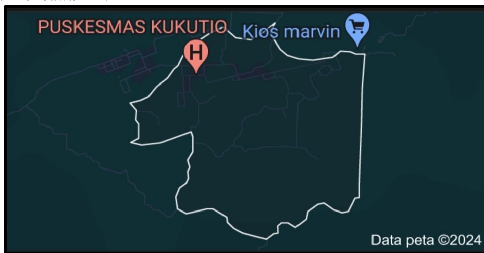
Gambar 2. Peta Desa Kukutio, Kecamatan Watubangga, Kabupaten Kolaka.

Kegiatan pengabdian kepada masyarakat ini dilaksanakan di wilayah Desa Kukutio yang terletak di Kecamatan Watubangga, Kabupaten Kolaka. Lokasi pelaksanaan program dapat dilihat pada Gambar 2 di bawah ini.