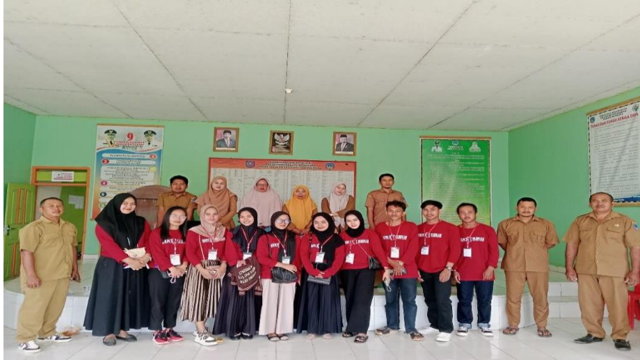
Gambar 3. Penyuluhan Kesehatan tentang Dampak/Bahaya dari Sampah.

dikumpulkan oleh tim melalui ketua RW pada minggu berikutnya.