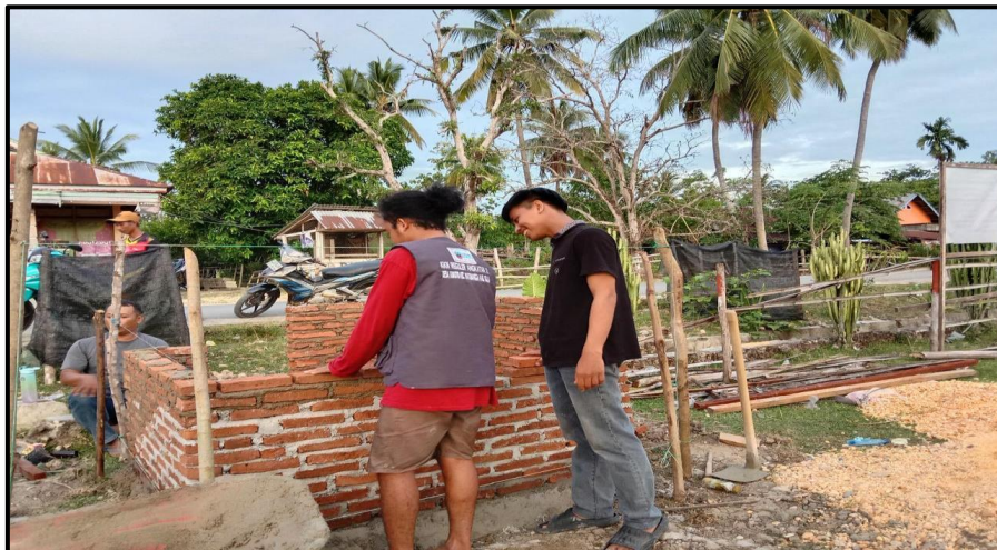
Gambar 6. Proses Penyusunan Batu Bata Tempat pembuangan sampah Permanen