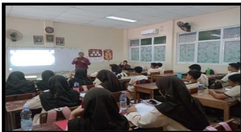
Gambar 4. Tahap posttest

Dengan membandingkan hasil pretest dan posttest, pelatih atau guru dapat menentukan apakah intervensi yang dilakukan berhasil meningkatkan motivasi siswa terhadap matematika atau belum. Jika hasil menunjukkan peningkatan antusiasme, maka pelatihan tersebut dapat dikategorikan berhasil dalam membangkitkan minat siswa. Sebaliknya, jika hasil menunjukkan stagnasi atau penurunan, maka perlu dilakukan evaluasi ulang terhadap materi, metode, atau pendekatan yang digunakan.