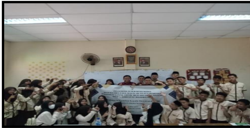
Gambar 5. Penutupan Kegiatan

Seluruh proses dilaksanakan di kelas IX pada mata pelajaran matematika. Siswa mendapatkan pengenalan tentang apa itu model matematika pada level yang paling dasar. Para siswa juga diperkenalkan dengan Program Matematika untuk membantu menyelesaikan masalah dalam pemodelan matematika.