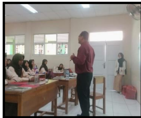
Gambar 1. Tahap Pengenalan dan Pre-test