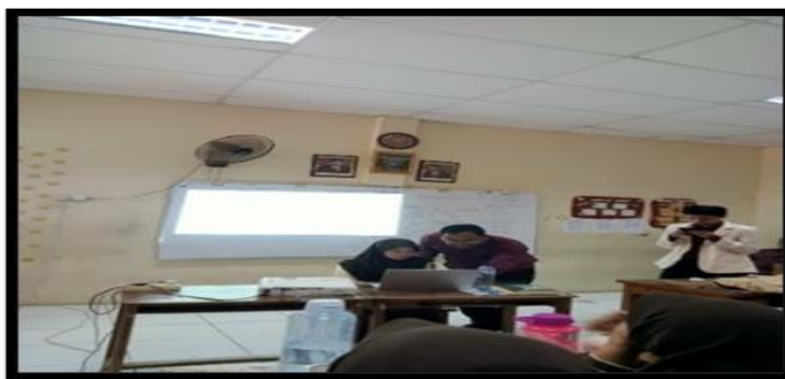
Gambar 3. Tahap Pelatihan Program