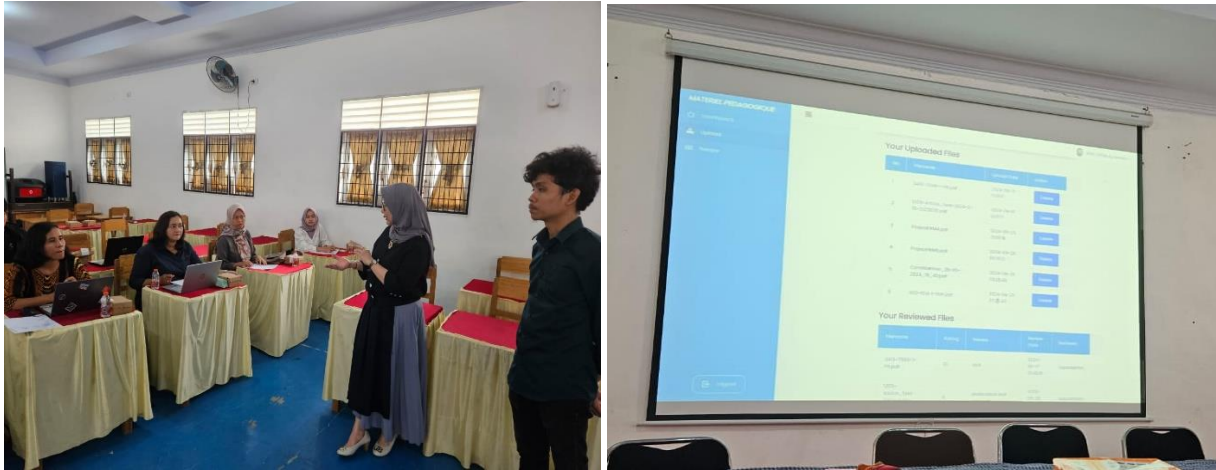
Gambar 1. Tim Memberikan pendampingan penggunaan website Allez-Écrire yang terintegrasi dengan Fiche de Travail Numérique

Sesi utama dari kegiatan ini melibatkan demonstrasi langsung tentang cara menggunakan website Allez-Écrire, termasuk pembuatan dan penggunaan fiche de travail numérique atau lembar kerja digital. Para peserta diberi panduan praktis mengenai cara menyusun aktivitas menulis yang memotivasi siswa serta cara mengoptimalkan fitur-fitur digital untuk mendukung pembelajaran yang interaktif dan efektif. Setelah sesi materi, peserta dibagi dalam kelompok untuk melakukan praktik langsung, di mana mereka membuat fiche de travail numérique sesuai dengan kurikulum Bahasa Prancis yang mereka ajarkan.